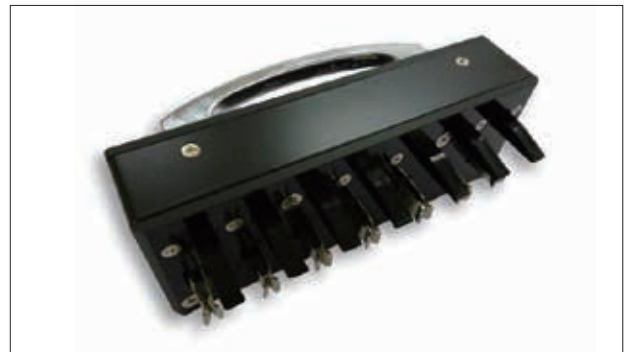
計器取替用プラグ 中部 四国 TTP-MS