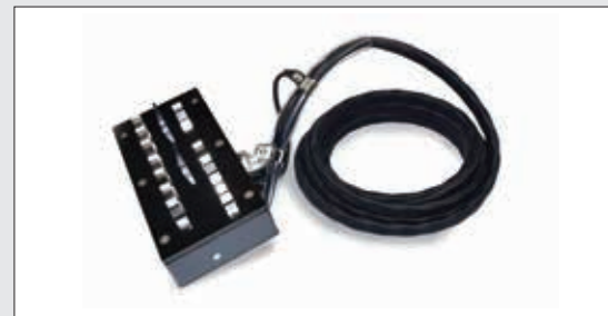
計器取替用プラグコード 中部 四国 TTP-M