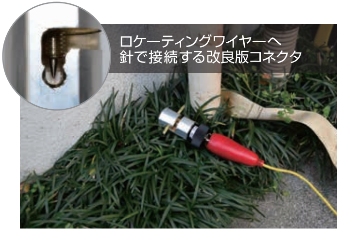
ロケーティングワイヤーへ 針で接続する改良版コネクタ